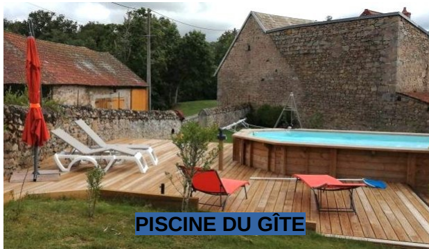
PISCINE DU GÎTE