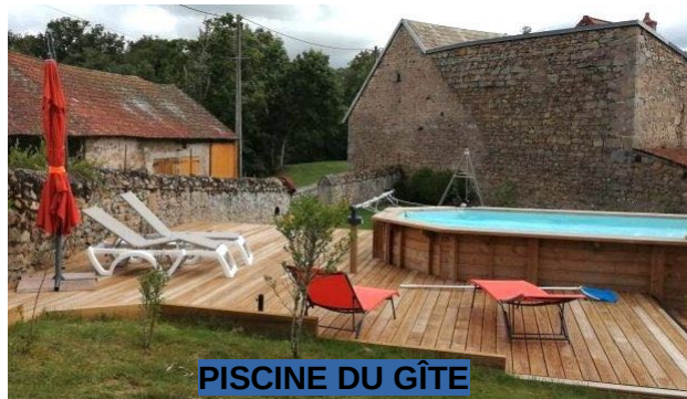
PISCINE DU GÎTE