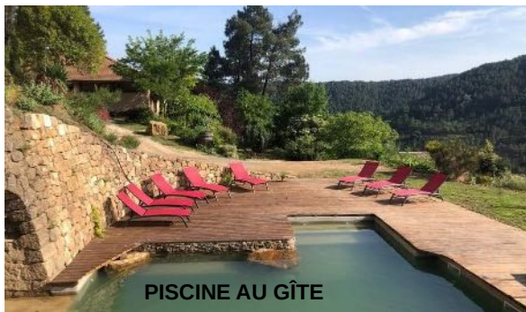
PISCINE AU GÎTE